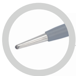
DETTAGLIO PUNTA TIPS DETAIL