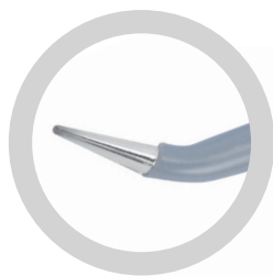
DETTAGLIO PUNTA TIPS DETAIL