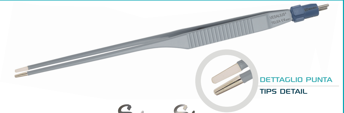
DETTAGLIO PUNTA TIPS DETAIL